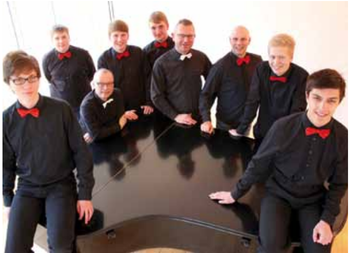
Das Männergesangsensemble M-Voxxx aus Vechta