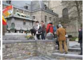
Ökumenische Gedenkstunde in Malmédy, im März 2014

and den Friedensnobelpreis bekamen, just in dem Jahr, in dem Deutschland in den 1920 gegründeten Völkerbund aufgenommen wurde, vermochte allerdings nicht darüber hinwegzutäuschen, dass die empfundene Schmach der Niederlage schwer zusetzte.